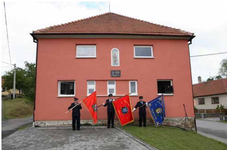
Slavnostní odhalení pamětní desky 25. května 2013.