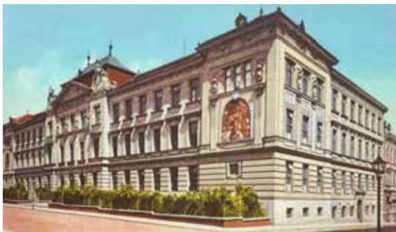
Česká reálka v Brně, Botanické ulici v roce 1880.

Po prázdninách nastoupil jako jednorokní dobrovolník k 8. pěšího pluku v Brně a dosáhl hodnosti desátníka. Předtím pluk bojoval v bitvě Rakušanů s Prusy u Hradce Králové v roce 1866 a po prohrané bitvě ustupoval se severní rakouskou armádou přes Moravu (viz str. 3). Příměří