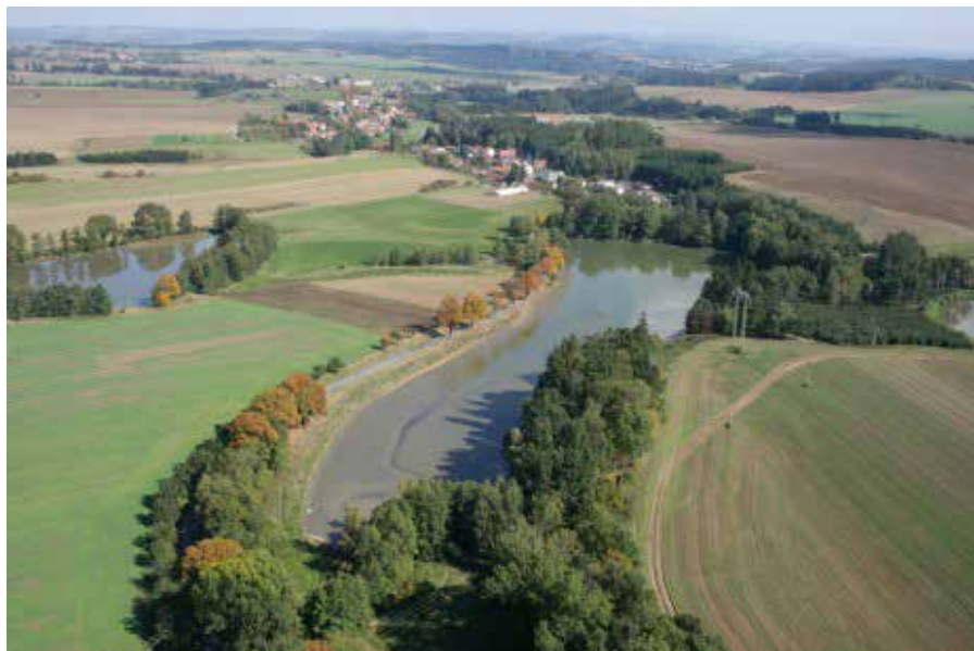
Rodná krajina kolem Kundratíc.