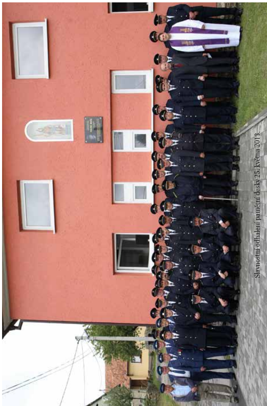
Slavnostní odhalení pamětní desky 25. května 2013.