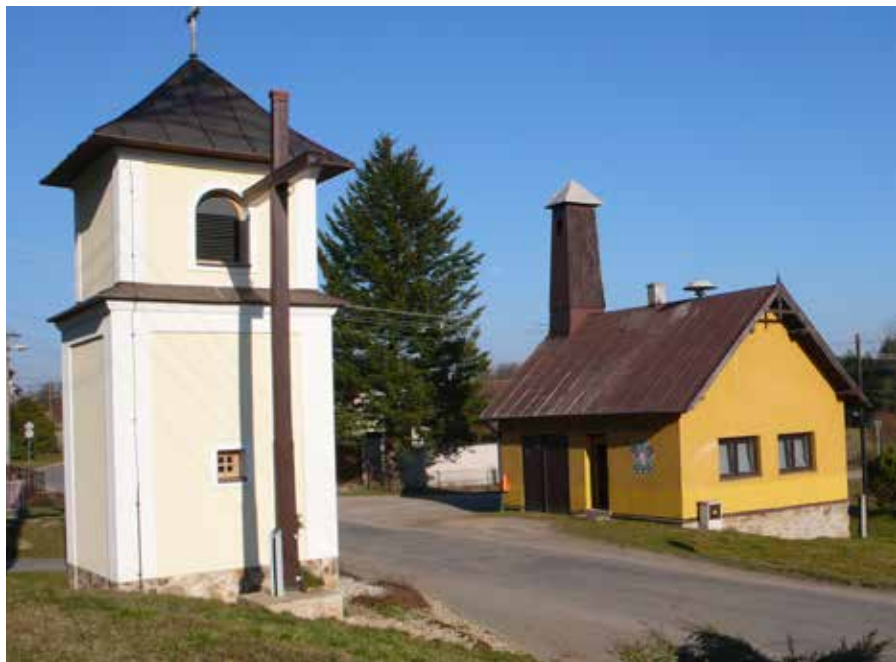
Střed Kundratic s kapličkou a hasičskou zbrojnicí.