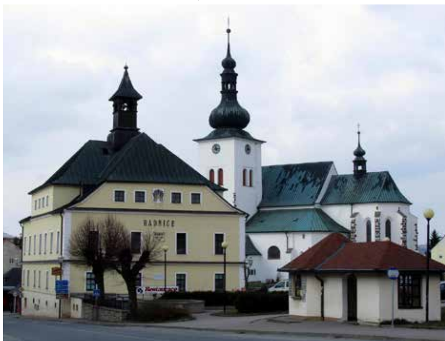
Křižanov – místo prvních školních let.